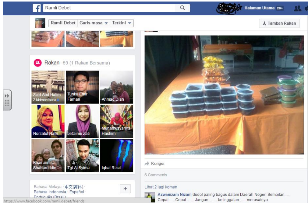
Salah satu post produk En Ramli

iv) Lain-lain (contoh : proses penghasilan produk, penglibat dalam aktiviti lain, dsb)